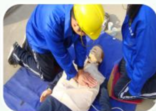
特种工实操考核现场