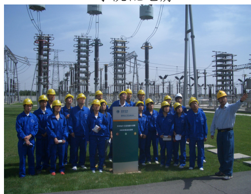
三门峡超高压管理处