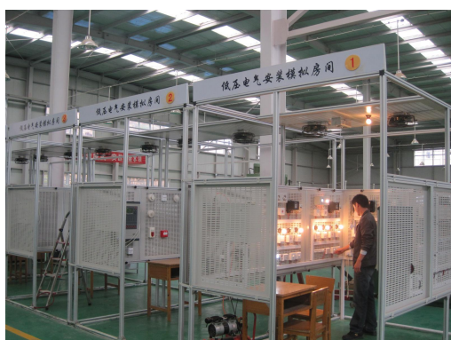
低压电气安装实训中心