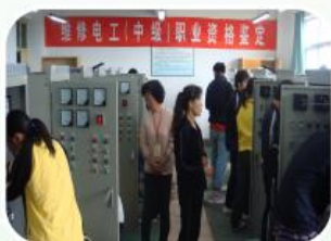
高级维修电工实操考核现场