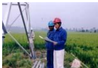
电力安装施工企业