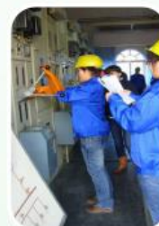
进网电工实操考核现场