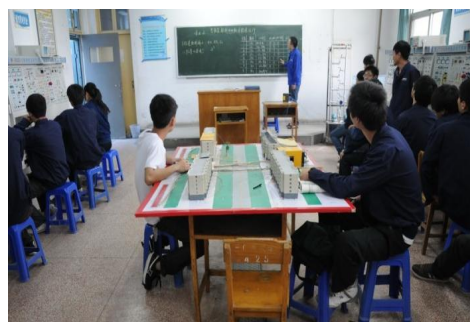
自动化创新实训室