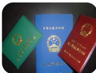
要求学生取得的“三证”