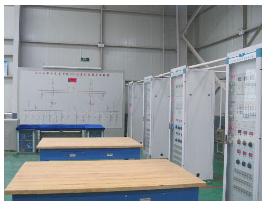
供配电综合自动化实训中心