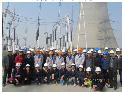
三门峡华阳发电有限公司